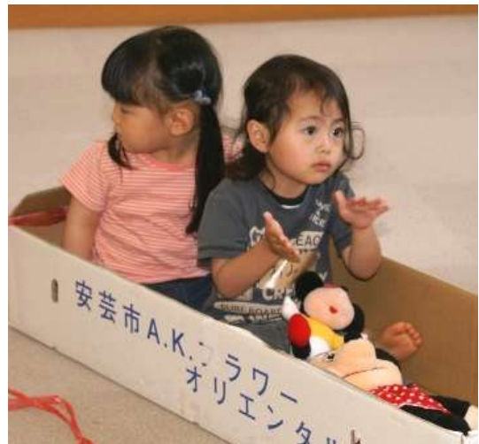
{Danbo-ru de asobo}da vez passada

Ainda não há dia do mês definido para promoção, porisso favor ligar para o Centro para confirmação,