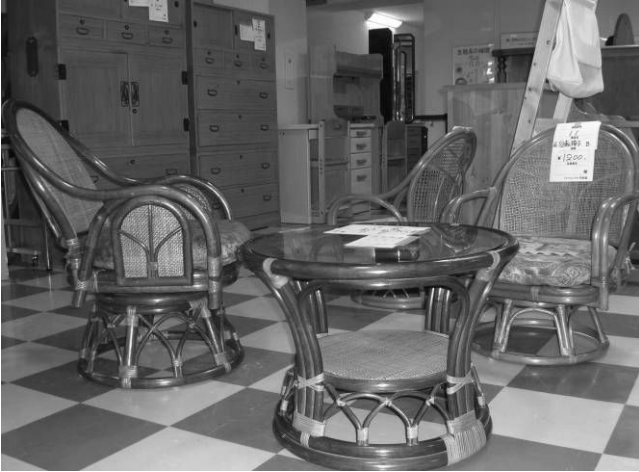
▲Espacio para reciclables, la loteria es el dia 16 de cada mes

☆Recycle Plaza Risaikan 480 Katsuse, Oji, Fujimi-shi. Tel & FAX 049-254-1160