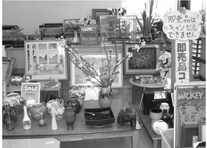
▲Lugar ng mga produktong "recycle" lottery ginaganap tuwing ika-16 ng bawat buwan ▲ lugar ng super-babang presyo ng produkto