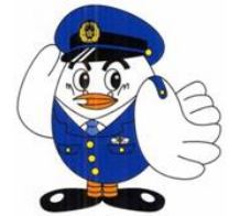
埼玉県警察シンボルマーク「ポッポくん」

日本で生活している皆さんが、犯罪や事故などに巻き込まれないため、日本の決められたルール（法律）をきちんと守りましょう。また、皆さんが犯罪や事故などを見たりした場合はすぐに警察へ通報または相談してください。