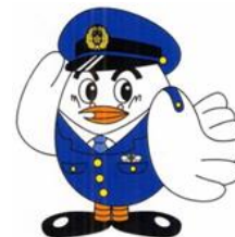
Symbol mark of Saitama Prefectural Police "Poppo"

Para prevenir verse envueltos en un accidente, los extranjeros en Japón deben obedecer las leyes y reglas japonesas. Si usted viera criminales o accidentes, por favor, repórtelo o consúltelo con la policía de inmediato.