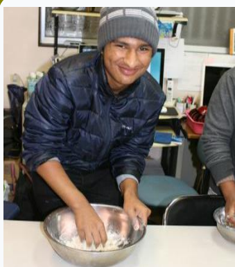
Noong Dec. 22: Ebento ng Paggawa ng Soba

(Komposisyon ni Ms. An Unju, staff ng FICEC)