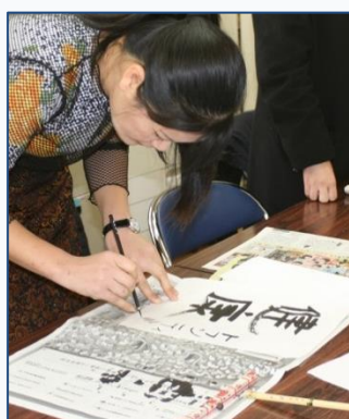
Noong Jan. 12: Pagsusulat ng paunang calligraphy ng taon, gamit ang Japanese writing brush at ink.