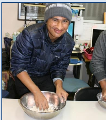
22/dez., confecção de “soba”