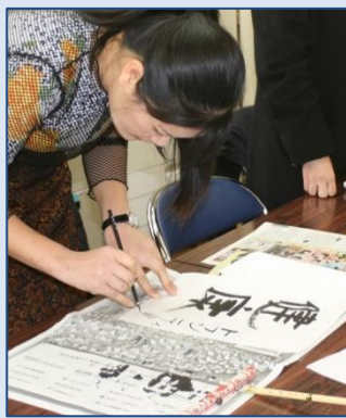
12/jan. kakizome usando sumi e pincel