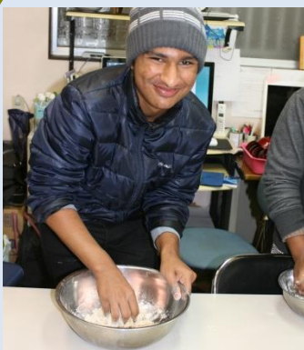
Dec. 22: Experiencia de hacer soba.