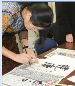
Ene 12: Experimenta la primera caligrafía del año con un pincel y tinta especial para la ocasión.