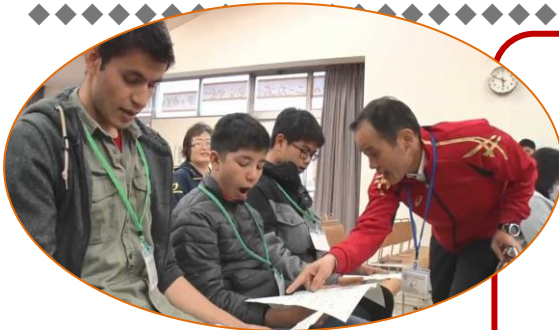
川口市立芝西中学校 陽春分校(ようしゅんぶんこう)