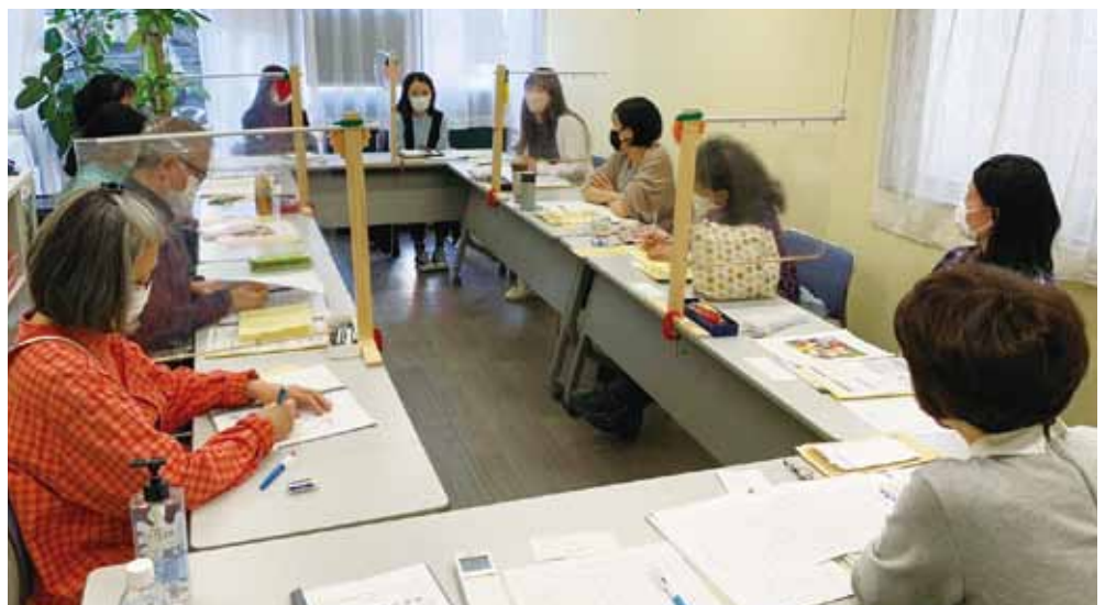
上／講師が作成した同行通訳養成講座用冊子 下／第一回講座の様子。8月まで毎月2回開催します。